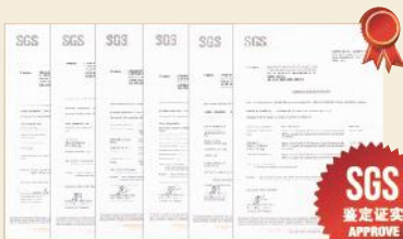
Certificate of SGS's Lab Report